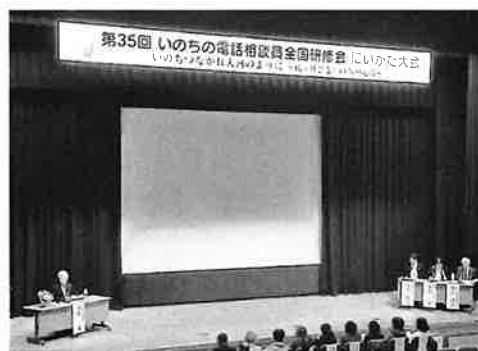
大会3日目「シンポジウム」の風景

2年ぶりの開催に参加者の熱い思いがみなぎっているのを感じました。最後は「かけよう心をつなぐ橋」2019年おかやま大会(10/24～26)にバトンタッチされました。(H.F.)