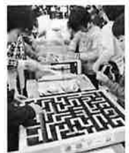
ゲームに夢中の子どもたち

創立45周年記念バザーは11月3日文化の日に晴天の下開催されました。会場の教会の前には開催の1時間以上前からご近所の方がたくさん並んで待っておられ、教会の中ではアクセサリー、バッグ、靴、雑貨、衣類、食器、洗剤等が所狭しと並んでいました。今年は幼稚園の建て替え工事のため中庭が使えず、教会の周りの道路をお借りして子供ゲーム、フランクフルト、チヂミ、豚汁、おでん、焼きそば、ぜんざい、ちらし寿司、本、野菜などの模擬店をたくさんのお客様に楽しんでいただきました。今年のおバザーで特に気が付いたことは幼児を連れて親子や地域の子どもたちがたくさん来場してくださったことです。楽しいバザーを開催でき、寄贈していただいた企業様や参加していただいた皆様方に心から感謝申し上げます。