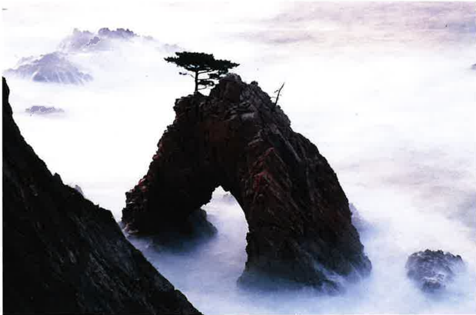
「千貫松島」(平成19年度山陰海岸写真コンクール入賞作品)鳥取県岩美町での撮影